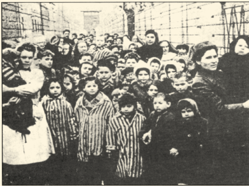
Bambini e mamme in attesa per le camere a gas.