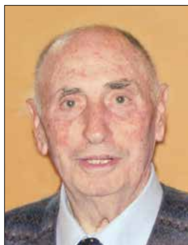
Natale Este 4° anniversario