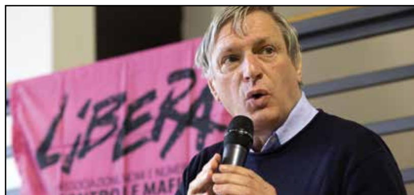
Don Luigi Ciotti

"Bisogna far diventare sofferenza personale ciò che accade al mondo, così si può cambiare." Questo è l'invito che Papa Francesco ci fa con la sua Enciclica sull'ambiente ed è anche il tema centrale della conferenza che si è svolta sabato 30 Aprile a Trento, "Crisi ambientale e crisi etica, due facce dello stesso problema". Don Luigi Ciotti e Luca Mercalli hanno lanciato un messaggio forte e chiaro: i grafici e i dati che vengono mostrati da anni nel tentativo di far comprendere quanto sia grave la crisi ambientale che imperversa sul nostro pianeta, non sono solo numeri. Stiamo vivendo un momento storico unico, l'Antropocene, in cui l'uomo non è più governato dalla natura, ma la domina facendo del male a se stesso e, soprattutto, alle generazioni future; un periodo in cui la specie umana, da sola, utilizza il 25% delle risorse naturali, che dovrebbero essere a disposizione delle milioni di specie presenti sulla Terra.