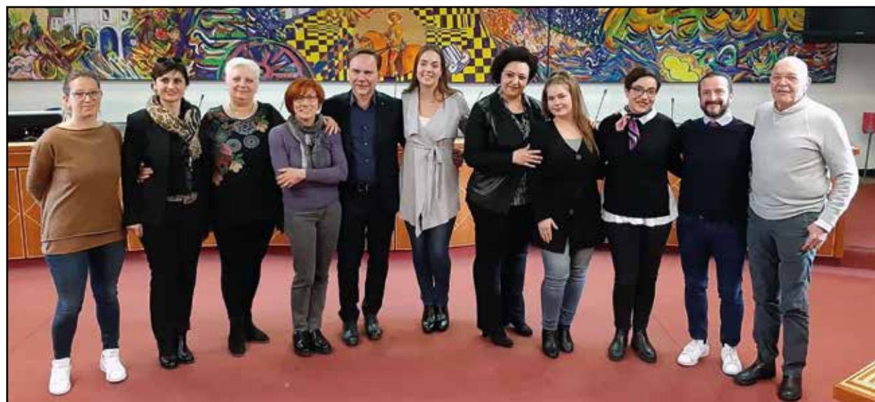
I responsabili dell'accordo in sala consiliare.