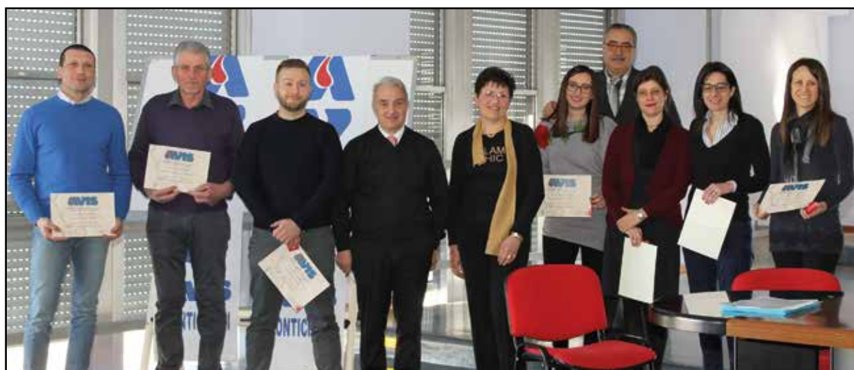
Foto ricordo di alcuni dei premiati presenti all'assemblea.